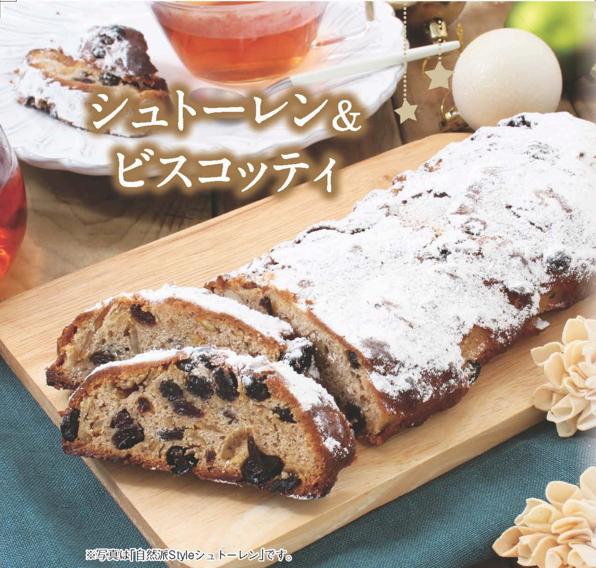
※写真は「自然派Styleシュトーレン」です。

自然派Style 国産のオレンジピールとレモンピールをたっぷり使用した、風味豊かな味わい。